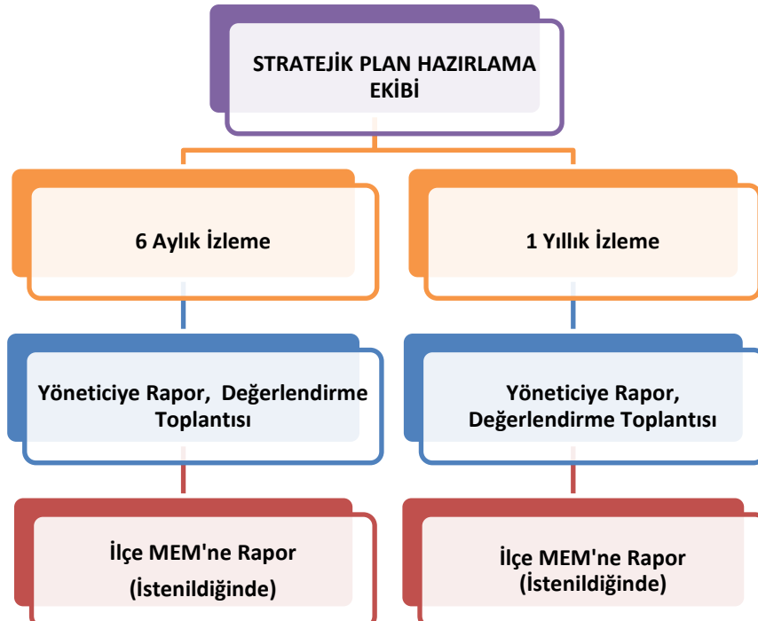
Şekil 2 İzleme ve Değerlendirme Süreci

Müdürlüğümüzün 2034-2028 Stratejik Planı İzleme ve Değerlendirme sürecini ifade eden İzleme ve Değerlendirme Modeli hazırlanmıştır. Okulumuzun Stratejik Plan İzleme-Değerlendirme çalışmaları eğitim-öğretim yılı çalışma takvimi de dikkate alınarak 6 aylık ve 1 yıllık sürelerde gerçekleştirilecektir. 6 aylık sürelerde Okul Müdürüne rapor hazırlanacak ve değerlendirme toplantısı düzenlenecektir. İzleme-değerlendirme raporu, istenildiğinde İlçe Milli Eğitim Müdürlüğüne gönderilecektir.